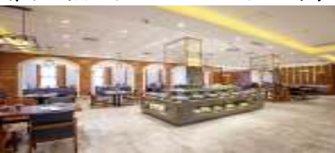
中山孫文西路文化步行街